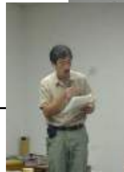
志村委員長による審査公表 (東北芸術工科大学教授)