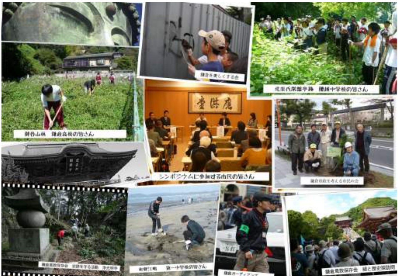
(世界遺産登録を推進する市民活動)