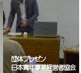
団体プレゼン 日本青年事業経営者協会