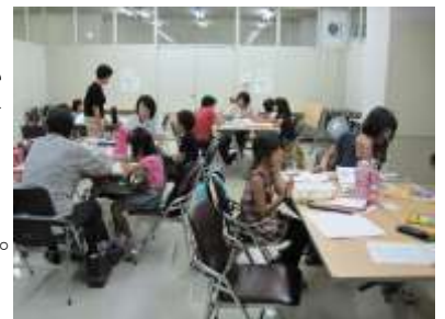
(自主事業 学習支援の様子)

同会の趣旨に賛同の方および、支援会員か依頼会員になりたい方はファミサポのホームページをご覧ください。 (取材 廣明)