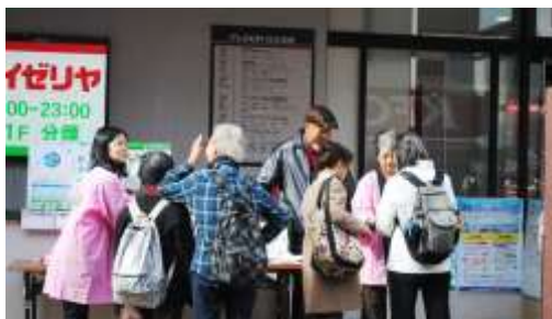
(スーパー店頭での分別減量啓発キャンペーン)