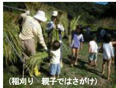
(稲刈り 親子ではさがけ)