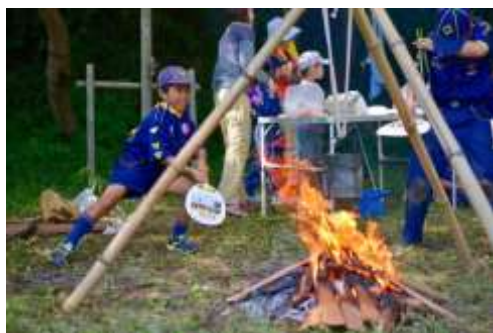
(保護者も一緒に楽しんでいます)