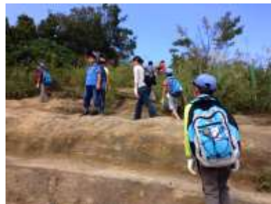
(天園へハイキング。岩場を登って、鎌倉アルプスの最高地点に到着!)