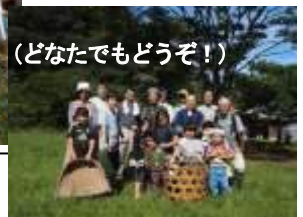
(どなたでもどうぞ！)