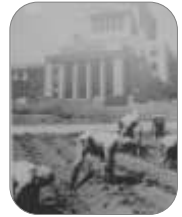
(サツマイモ 植え付け風景)