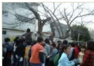
(大船小学校桜ワークショップ)

地域の小学校校庭の桜の治療の実践や夏休みには、地元の美術学院の協力を得て、桜の樹名板製作のワークショップを開催し、子どもたちに愛校心、樹木に愛着をもって接する心を育てる一助としています。