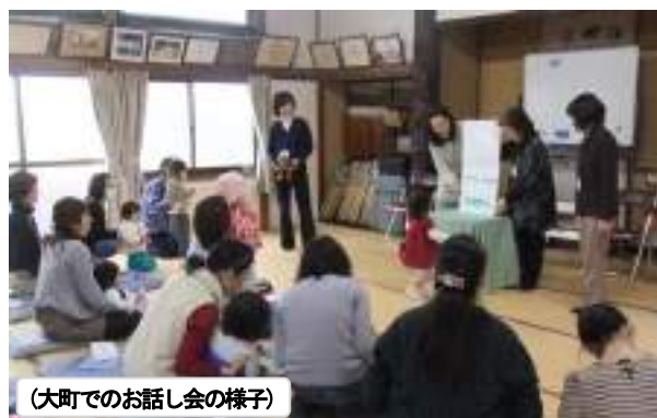
(大町でのお話し会の様子)

2009年から3年間、市提案の協働事業として深沢子ども会館の運営に携わった後、児童・乳幼児・保護者の方たちに「市民健康課委託事業」や「お話し会」などの「場」を通して、人との関わり大切さや子育ての楽しさを伝えようと活動を続けてきました。