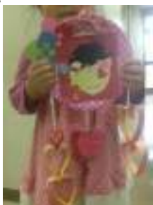
(虫歯の予防の時のエプロンシアター)

問合せ先：bouquet_kamakura@yahoo.co.jp (ブーケ鎌倉)