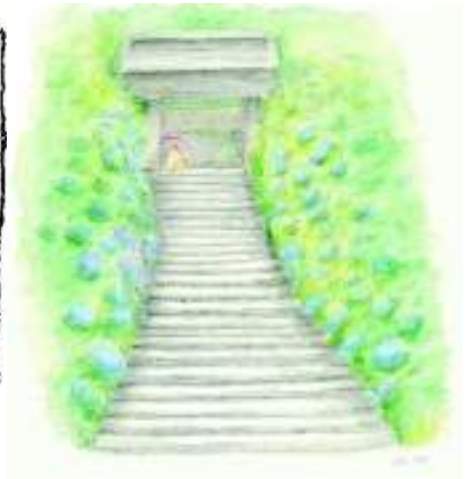
(明月院のアジサイ)

第79号 平成28年(2016年)6月発行(季刊) 鎌倉市市民活動センター広報紙