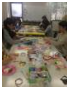
(ハロウィンの工作)

昨今、社会が変貌する中で、子育てをすることは昔以上に大変になってきており、子育てに困難を感じて悩む母親が増えています。国や市も多くの施策を打ち出して支援しておりますが、なかなか好転する兆候は見られません。